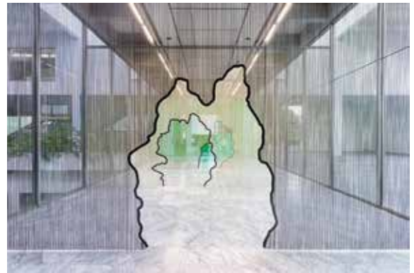
Daniel Steegmann Mangrané "∞" 2020, tende in alluminio Kriska e telai in acciaio tagliato al laser e verniciato a polvere, dimensioni variabili. Per gentile concessione dell'artista, Esther Schipper, Berlino e Taipei Fine Arts Museum