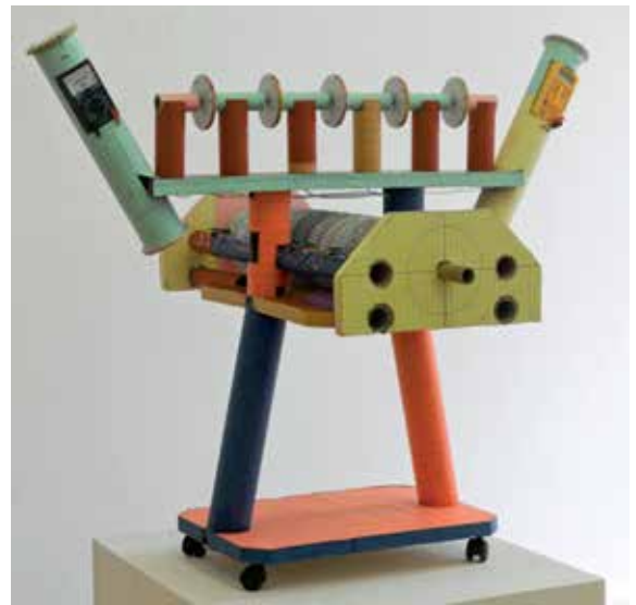
Jean Katambayi Mukendi "Yllux" 2012, cartone, penna, carta, cavi elettrici, ruote di plastica, 102 x 119 x 93 cm.

Infine, la zona dei "New Diplomatic Encounters" è uno spazio workshop per portare le persone del pubblico a partecipare a discussioni su quanto proposto dalla mostra, cercando modalità espressive affinché si possa riuscire a interagire tra questi diversi pianeti. In definitiva, un pluralismo che può esaltare ogni soggettività e ogni desiderio di esprimersi.